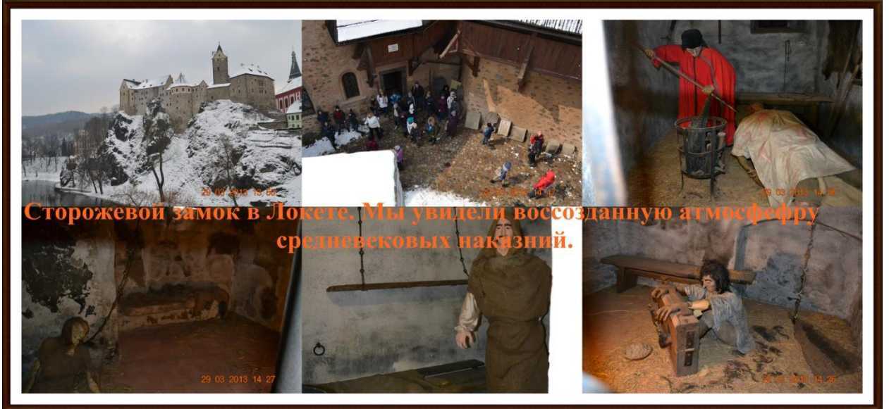
Сторожевой замок в Локете. Мы увидели воссозданную атмосферу средневековых наказаний.