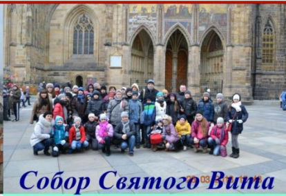
Собор Святого Вита