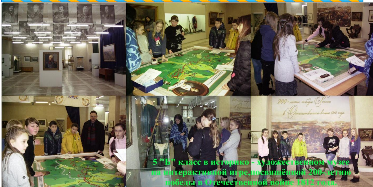
5 "Б" класс в историко - художественном музее на интерактивной игре, посвящённой 200-летию победы в Отечественной войне 1812 года.