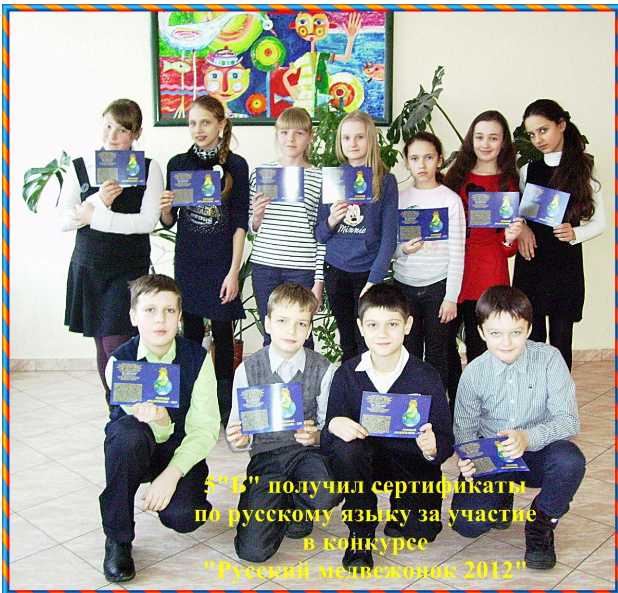
5 "Б" получил сертификаты по русскому языку за участие в конкурсе "Русский медвежонок 2012"