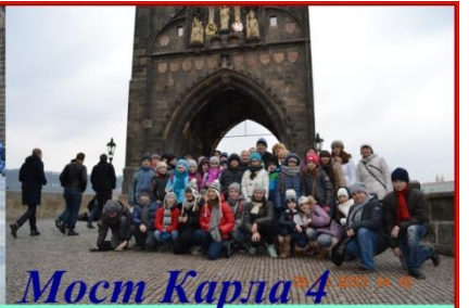
Мост Карла 4