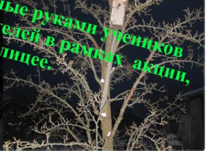
Кормушки для птиц, сделанные руками учеников 5 "Б" класса с помощью родителей в рамках акции, проходившей в лицее.