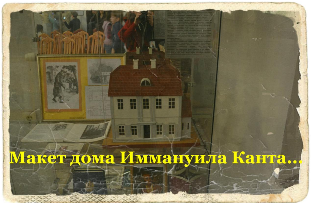
Макет дома Иммануила Канта...