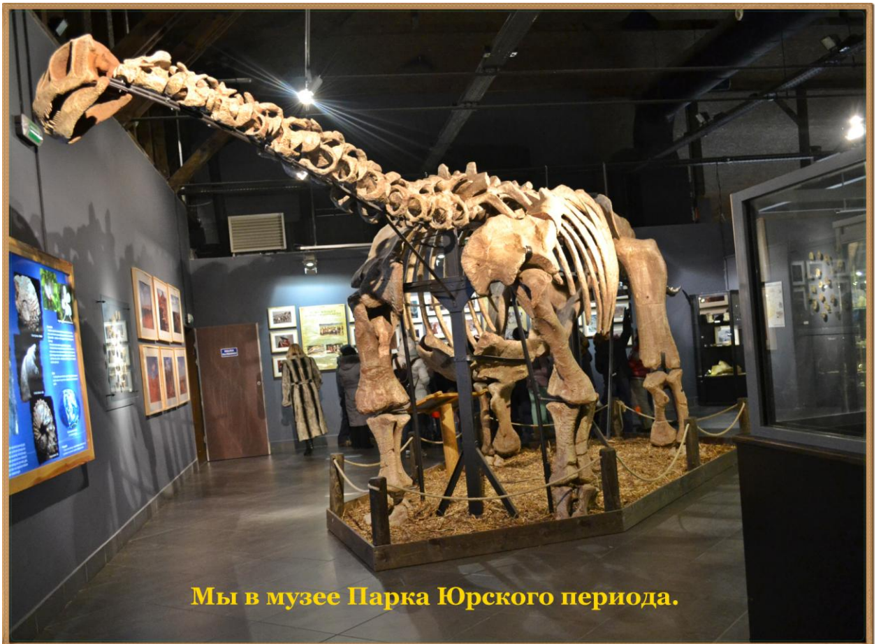
Мы в музее Парка Юрского периода.