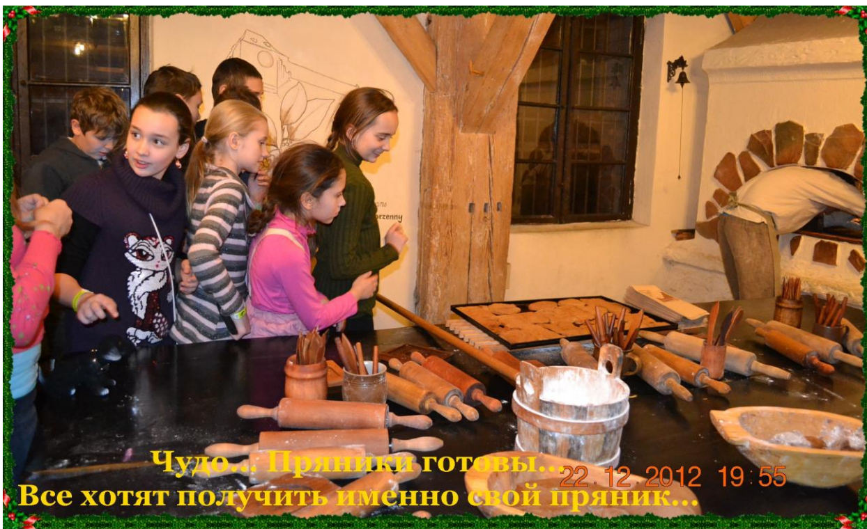
Чудо... Пряники готовы... 22.12.2012 19:55 Все хотят получить именно свой пряник...