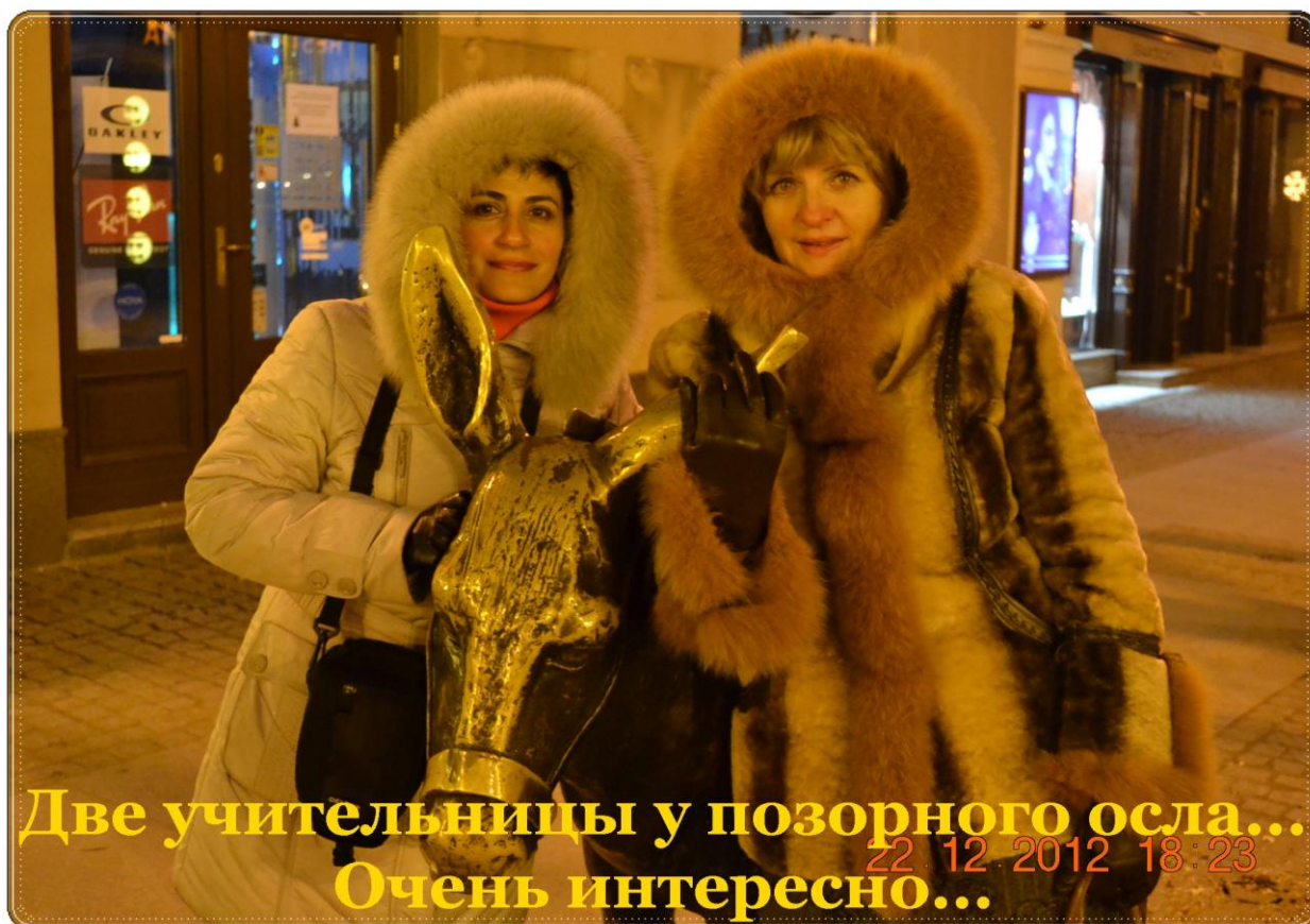
Две учительницы у позорного осла... 22 12 2012 18:23 Очень интересно...