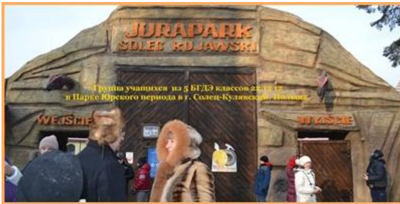
Группы учащихся из 5 БГДЗ классов 24.01.17 в Парке Юрского периода в г. Сolec-Кузавский, Польша