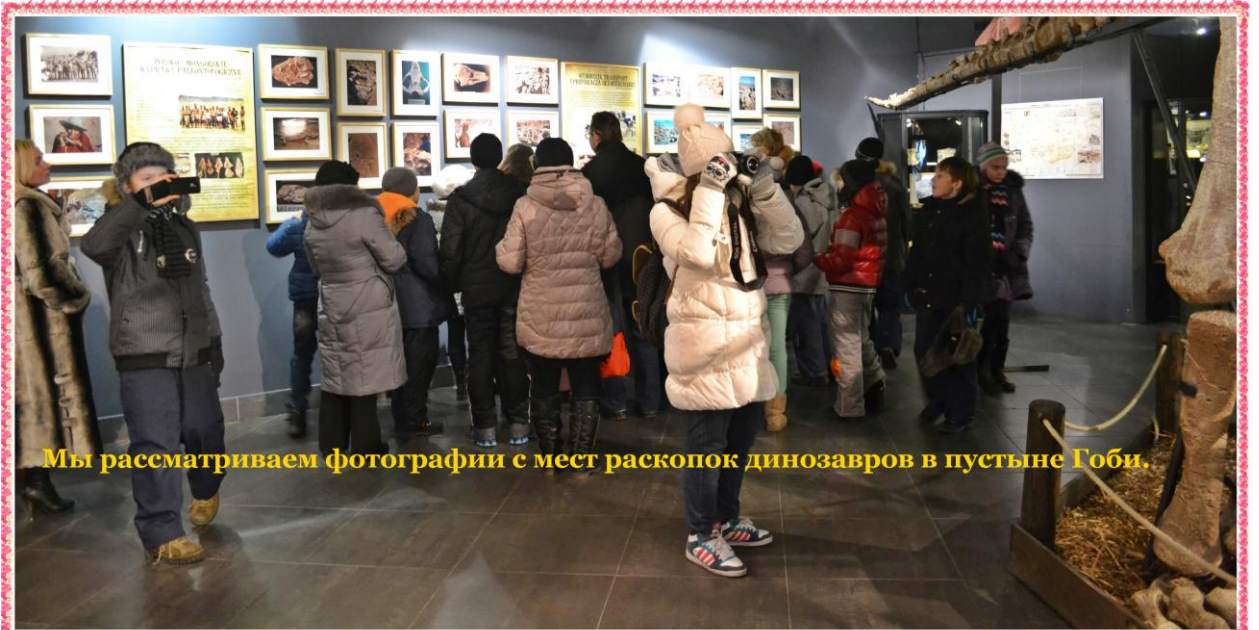
Мы рассматриваем фотографии с мест раскопок динозавров в пустыне Гоби.