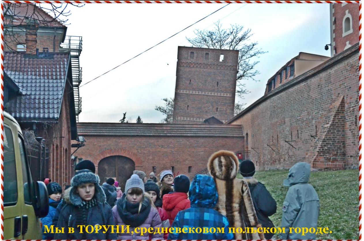
Мы в ТОРУНИ, средневековом польском городе.