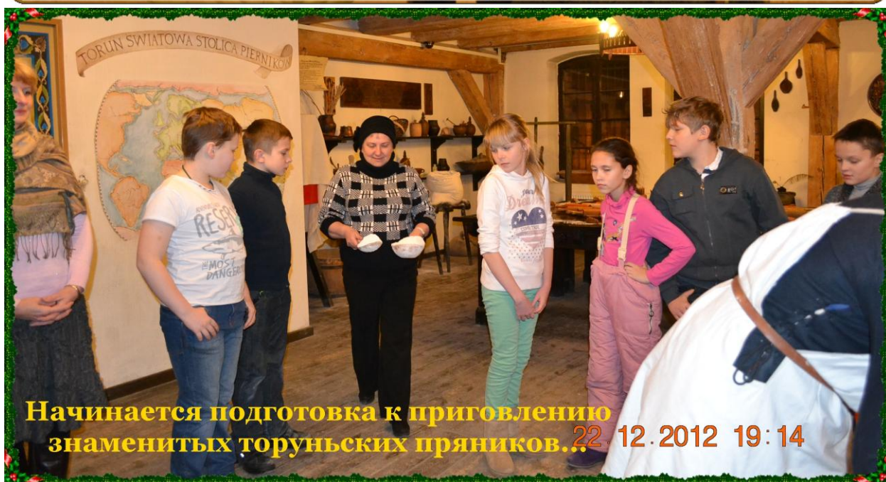
Начинается подготовка к приговлению знаменитых торуньских пряников...22 12 2012 19:14