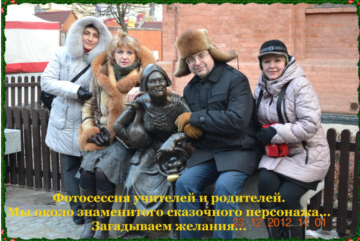
Фотосессия учителей и родителей. Мы около знаменитого сказочного персонажа... Загадываем желания... 23.12.2012 11:01