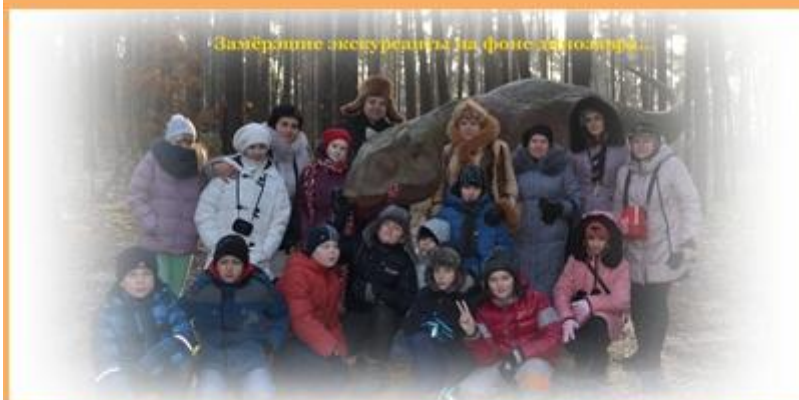
Замерзните экскурсанты на фото динозавра...