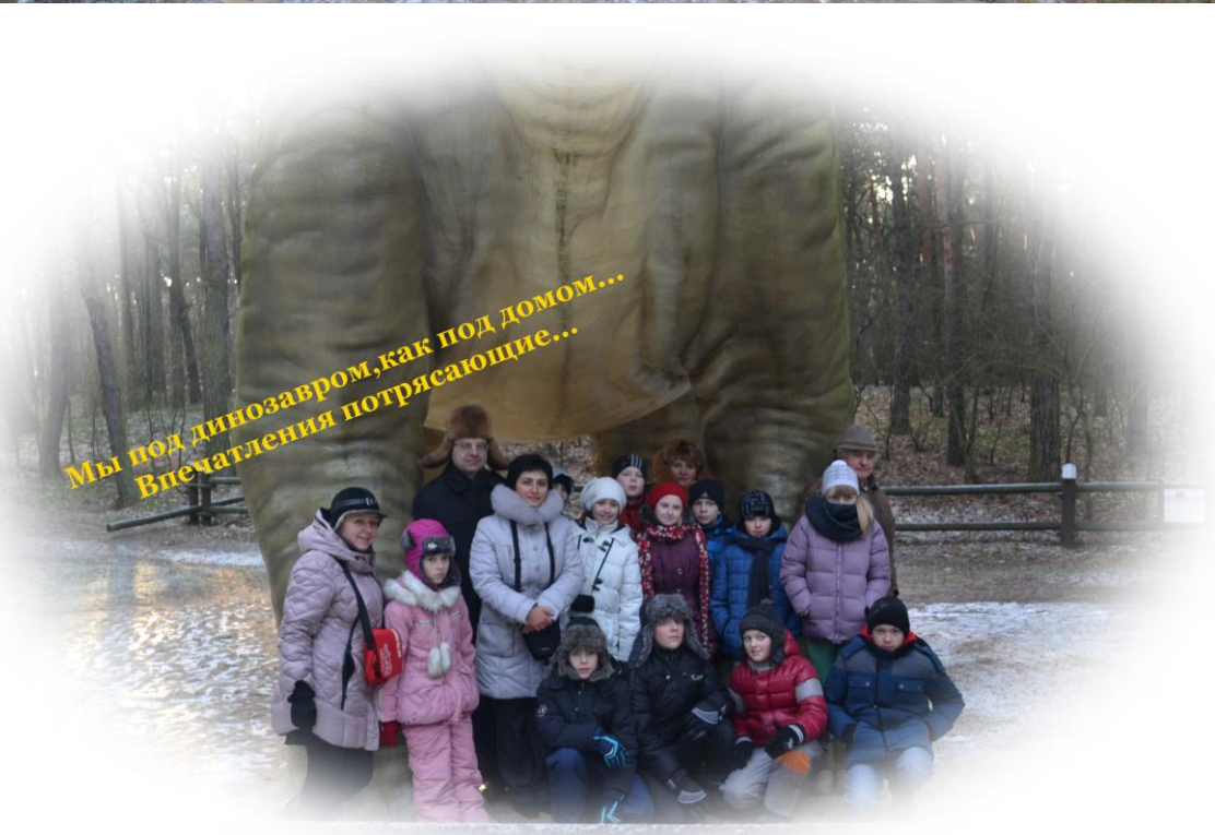
Мы под динозавром, как под домом... Впечатления потрясающие...