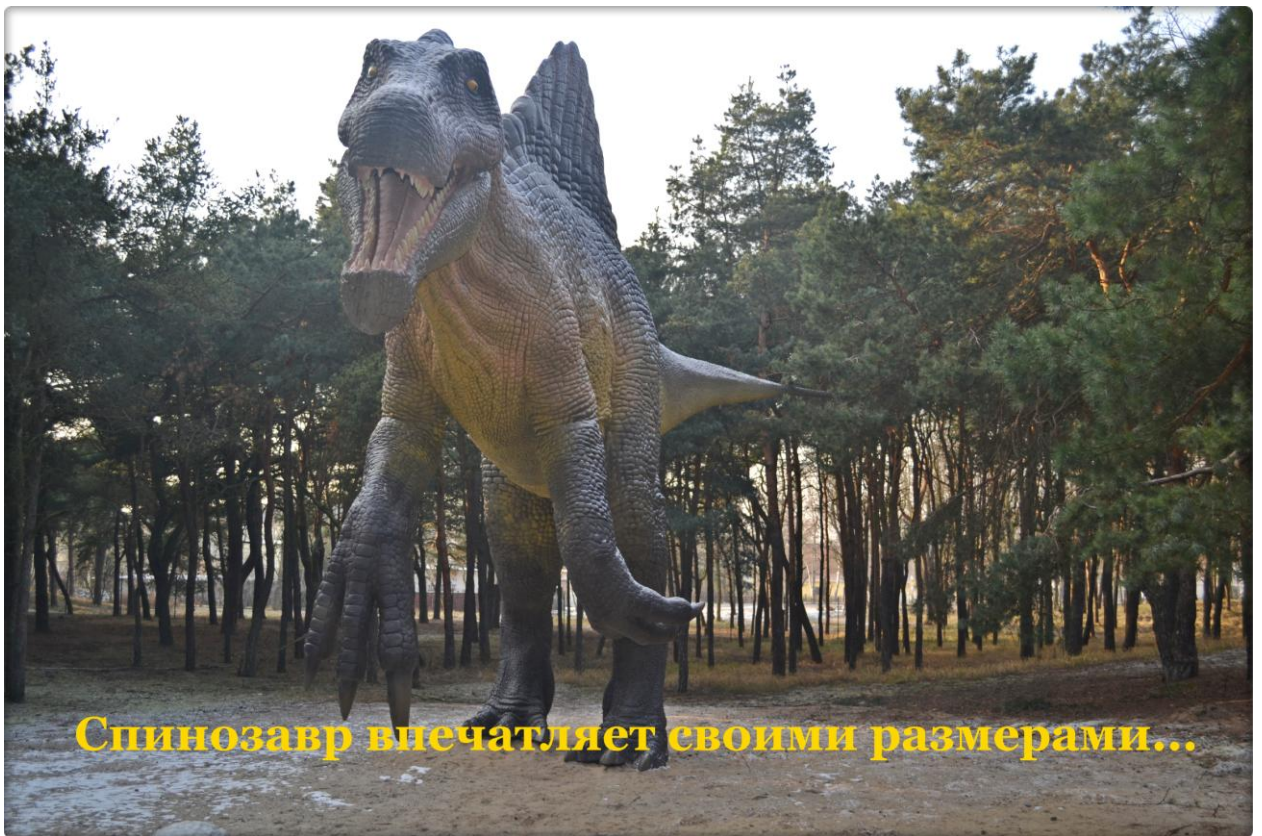
Спинозавр впечатляет своими размерами...