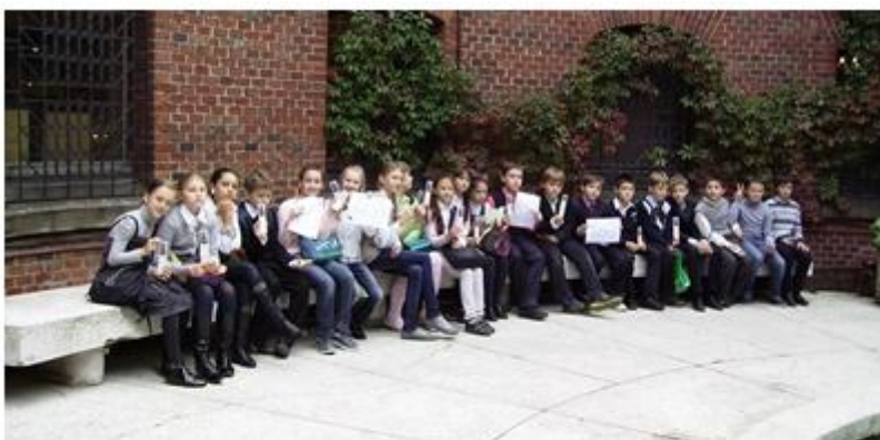
Фотосессия 5 "Б" класса после обнаружения клада

5 "Б" в поисках спрятанного клада во дворе Музея Янтаря