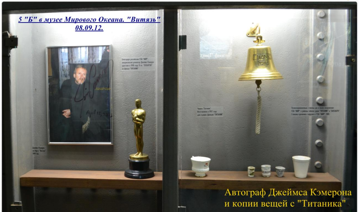
Автограф Джеймса Кэмерона и копии вещей с "Титаника"