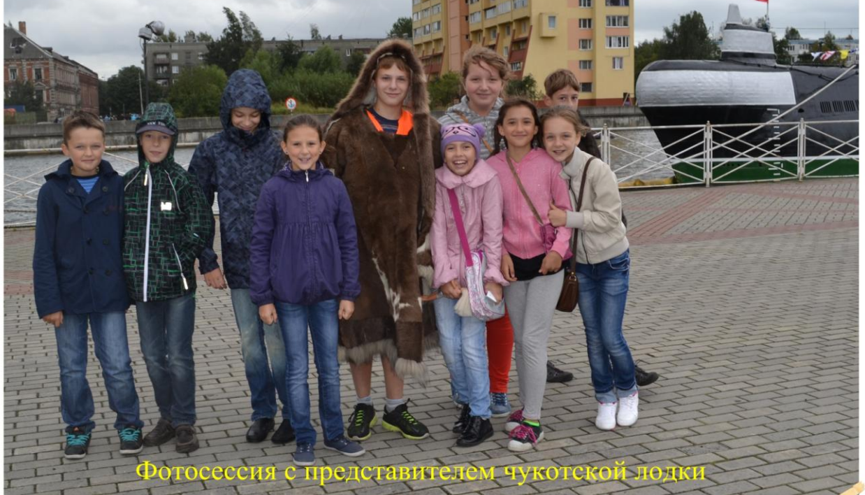
Фотосессия с представителем чукотской лодки